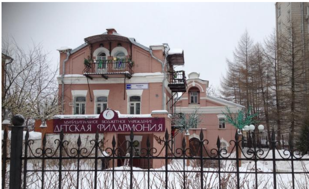
ул. Ленина, четная сторона, вид с запада на восток, западный фасад Объекта. Фото 03.01.2018 г.

Фотофиксация объекта культурного наследия (памятника истории и культуры) народов российской федерации местного (муниципального) значения «Старообрядческая молеельня, 1908-1910 гг., 1914-1915 гг.», расположенного по адресу Кировская область, г. Киров, ул. Ленина, д. 100.